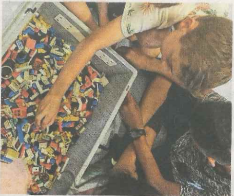
Savoir s'occuper autrement qu'avec un écran.

Depuis mardi et jusqu'à jeudi prochain, l'école élémentaire Jean-Monnet, à Sélestat, organise un défi « 10 jours sans écran ».